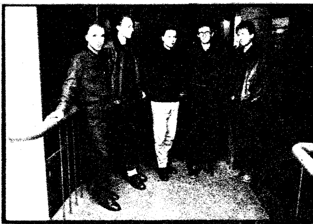
»Variété« na stubama Omladinskog radija.

Grupa »Abbildungen Variété« po mnogo je čemu tipična slovenska alternativna skupina. Iako je oblik njihova glazbeno-medijskog i kulturnog djelovanja od 1983. do prve polovice 1985. tumačen kao »reinkarnacija i afirmiranje slovenske kulture«, »Abbildungen Variété« i sad zadržavaju važno mjesto unutar alternativnih djelatnosti u SR Sloveniji, sa ciljem da se mnoštvo mladih umjetnika izdigne iznad statusa supkulturne atrakcije. Medijska zatvorenost i stanovita doza mističnosti važne su značajke djelatnosti toga kruga, pa tako i grupe »Abbildungen Variété«.